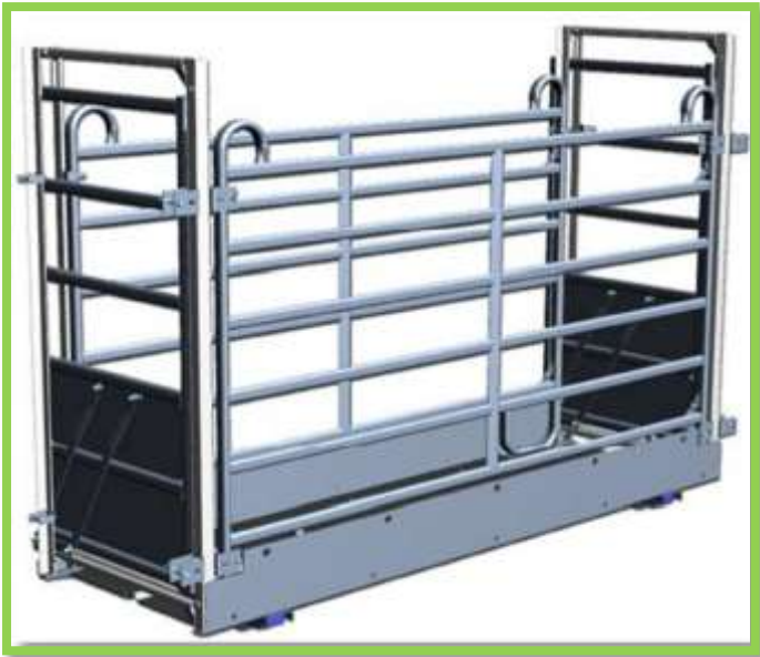
1. Varianta - váha s posuvnými dveřmi