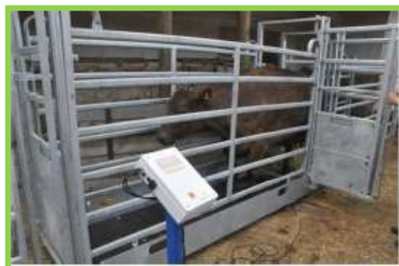
Varianta s použitím dvou posuvných dveří

Váha vybavená panely 2,54m a posuvnými dveřmi nesmí být pevně namontovaná na navazující uličku, ani se dotýkat žádných pevných předmětů.