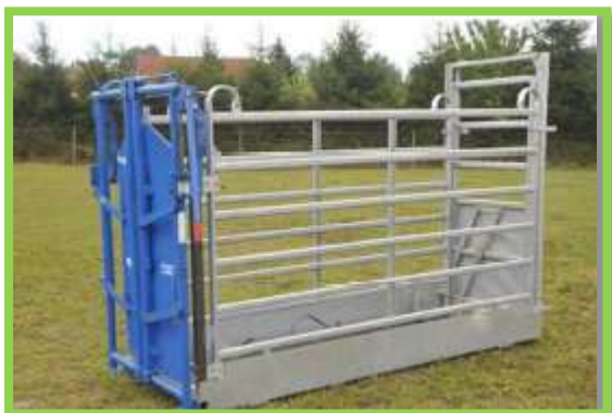
Varianta s fixačním čelem Priefert